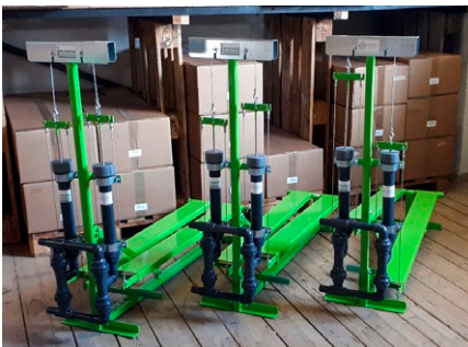
Bombas BASILEA em estoque

Durante vários anos, o pessoal local da ONG «ReachAcross» treina antigos nômades na irrigação com bombas de pedal para aumentar a produção agrícola. PEPOPU assegura a continuidade deste processo em andamento, enviando bombas BASILEA para Djibuti.