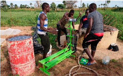
Bomba BASILEA de pedal em ação

Nossos parceiros garantem a manutenção das bombas e nossos especialistas os apoiam com visitas regulares, obtendo feedback para aprimorar a qualidade das bombas.