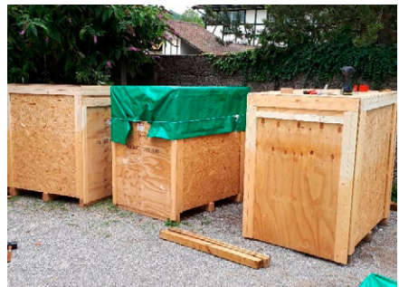
Bombas embaladas e preparadas em paletes, esperando o envio