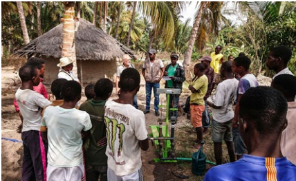
Swisscontact et le PEPOPU font la promotion de la pompe auprès des agriculteurs locaux

Avec le soutien du projet Horti-Sempre, fourni par swisscontact à Nampula, nous avons introduit la pompe à pédale BASILEA et la pompe à main BASILEA dans différentes communautés et signé une convention pour produire les pompes à l'école technique de Nampula.