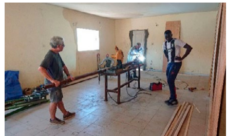
Mettre en place un atelier