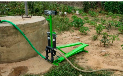
Pompe à pédale BASILEA et puits